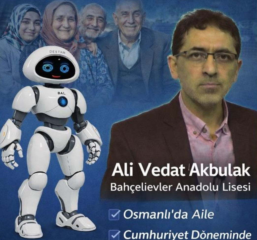
Ali Vedat Akbulak Bahçelievler Anadolu Lisesi